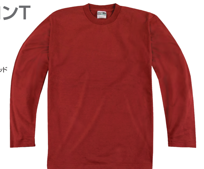
30 クリムゾンレッド