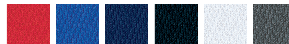
5 レッド 4 ロイヤルブルー 3 ネイビー 2 ブラック 1 ホワイト 11 グレー