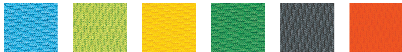
7 サックス 8 アップルグリーン 9 イエロー 10 グリーン 11 グレー 12 オレンジ