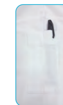
左袖に便利なポケット を付けました。