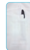
左袖に便利なポケット を付けました。