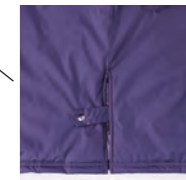
スリット調節機能