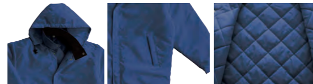
襟の部分にはフードを収納