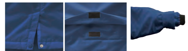
しゃも時にジヤマにならない様にスリットが入っています