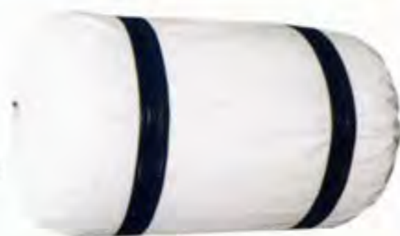
#300 ターポリンカバー付